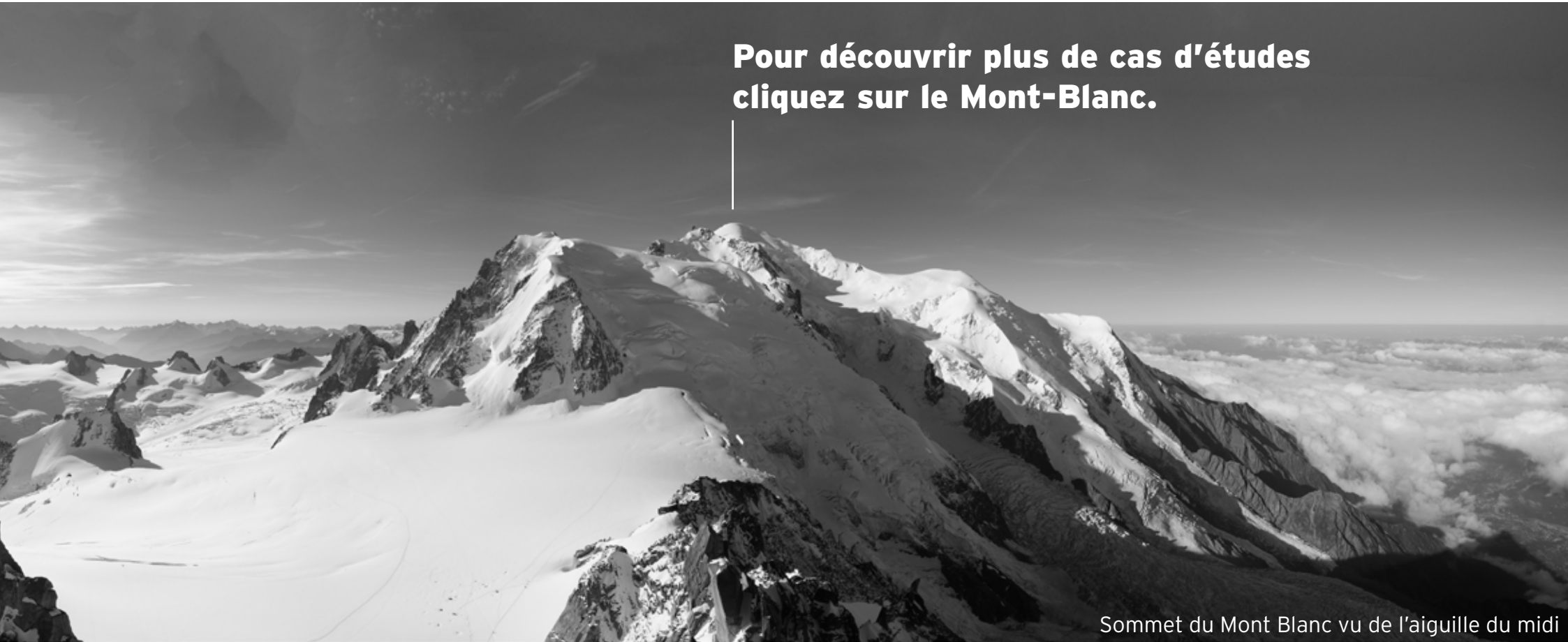
Sommet du Mont Blanc vu de l'aiguille du midi

Pour découvrir plus de cas d'études cliquez sur le Mont-Blanc.